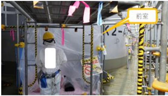
(写真 3 - 1) K 2 タンクエリア 前室の設置状況