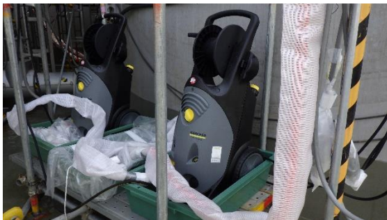
(写真 3 - 3) 近傍の高圧洗浄機の状況