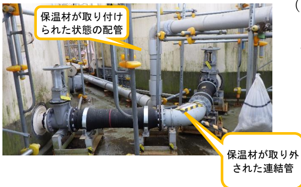
(写真2) K1南タンクエリア 保温材が取り外された連結管の状況