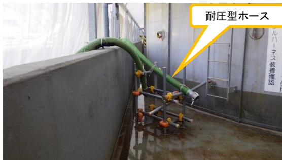
(写真5-1) K1北タンクエリア西側付近 (物揚場排水路の水の回収用耐圧型 ホース据え付け状況)