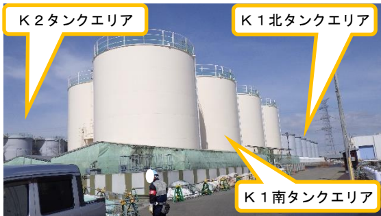
(写真1) K1南、K1北及びK2タンクエリアの外観 (南東側から撮影)