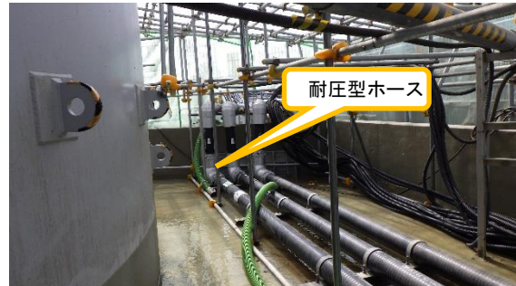
(写真5-2) K2タンクエリア南西側付近 (同左)