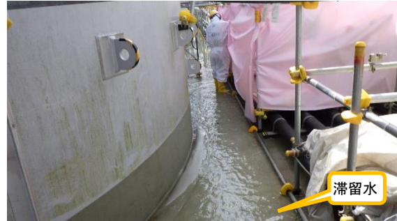
(写真4-2) K2タンクエリア東側付近