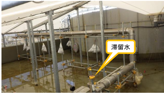
(写真4-1) K1北タンクエリア内堰入口付近