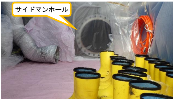
(写真 3 - 2) 前室内部の状況