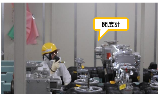
(写真 2) 開度計を確認する様子