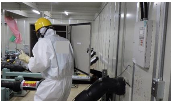
(写真 1) 集中監視室と連絡を取る様子