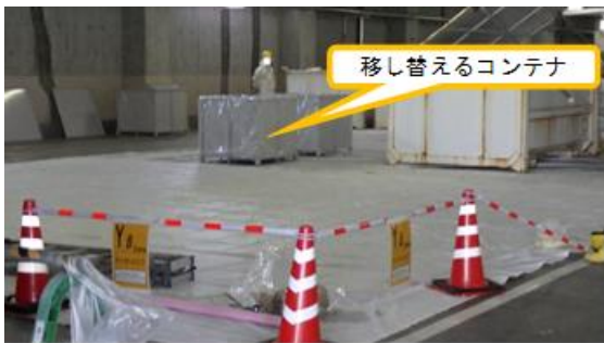
(写真2-2) 内容物を移し替えるコンテナ