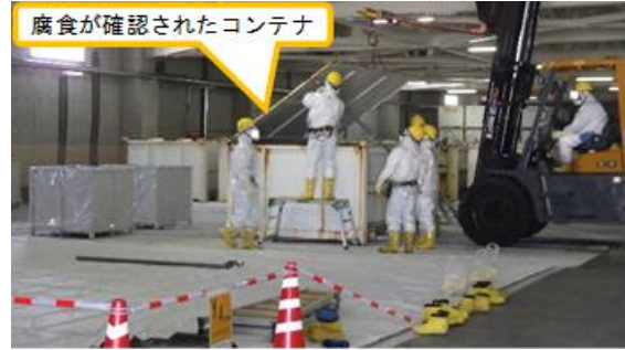
(写真1-2) ふたが開けられたコンテナの様子 (今回撮影)