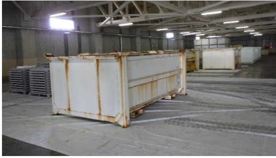
(写真1-1) 腐食が確認された大型コンテナの保管状況 (3月31日撮影)