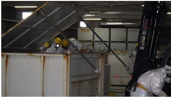
(写真2-1) コンテナから内容物を取り出す様子