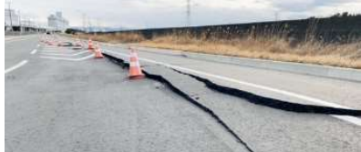
臨港道路5号ふ頭内線