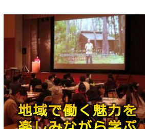
地域で働く魅力を楽しみながら学ぶ