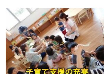
子育て支援の充実