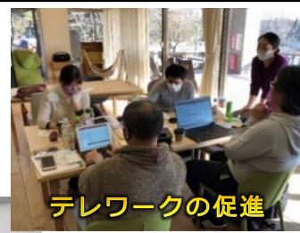
テレワークの促進