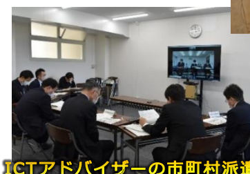
ICTアドバイザーの市町村派遣