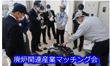
廃炉関連産業マッチング会