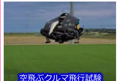
テトラ・アビエーション(株)の飛行試験の様子