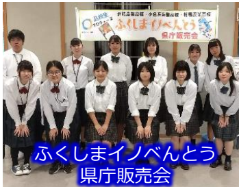
ふくしまイノベんどう 県庁販売会