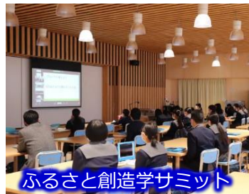
ふるさと創造学サミット