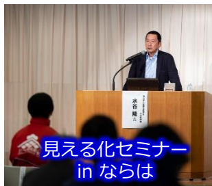
見える化セミナー in ならは