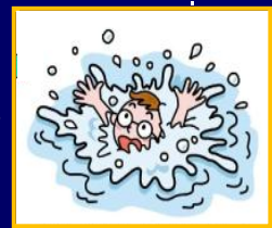
気づいたときには抜け出せない