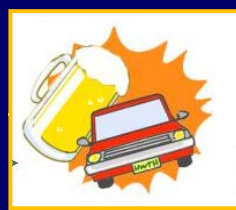
やがてこんなふうになる...