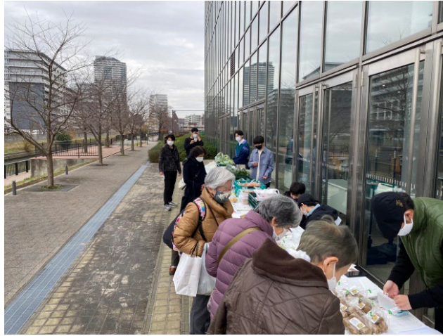
写真 5. 地域振興応援物産展の様子

地域振興物産展における米山チーム part2の収支計算書は図表7のとおりである。なお、支出から収入を引いた差額分の宅配料金を令和 3 年度「大学生の力を活用した集落復興支援事業」(実証実験)業務委託料として助成していただいた。