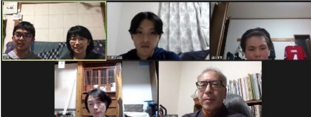
写真 1. Zoom ミーティングの様子