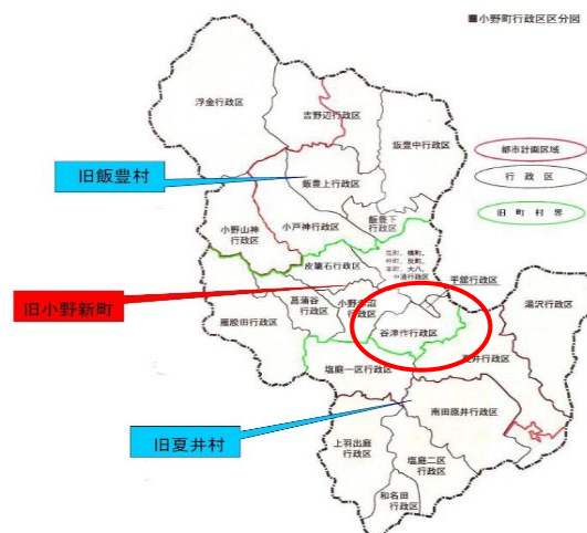
図表2 小野町の行政区分と谷津作行政区の位置