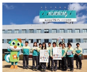
株式会社クレハ 生産・技術本部 いわき事業所のみなさん