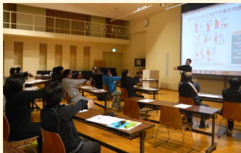
ルネサンス：VDTセミナー