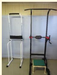
補助金活用：ぶら下がり健康器