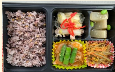
花王：スマート和食弁当 →内臓脂肪を溜めにくい食事(スマート和食)を体験