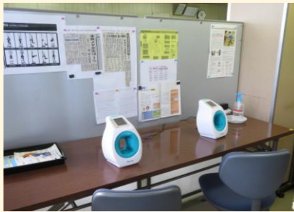
補助金活用：健康コーナー