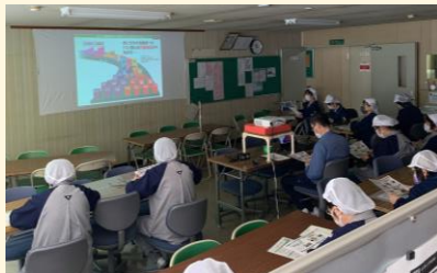
花王：食育セミナー受講風景