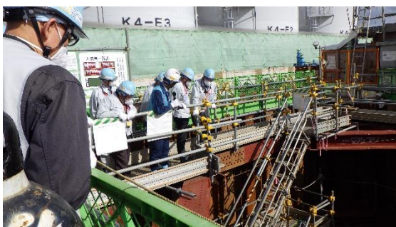
(写真2-3) D排水路立坑の状況確認