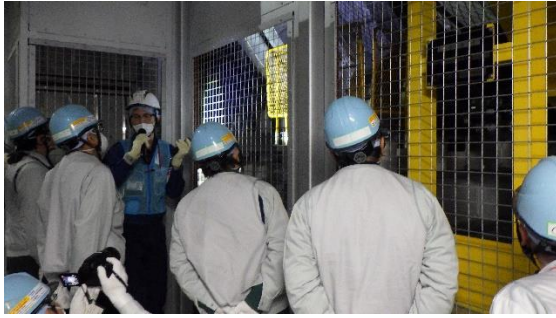
(写真3) 増設雑固体廃棄物焼却設備内の状況 確認の様子