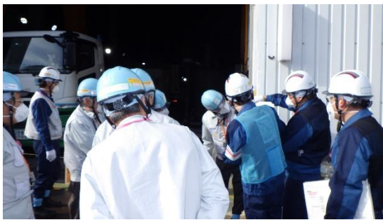
(写真2-1) 増設多核種除去設備の状況を確認する様子