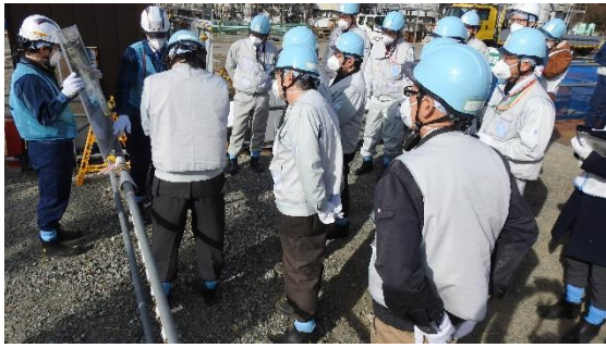
(写真1) 多核種除去設備処理水の放水立坑環境整備工事の状況説明の様子