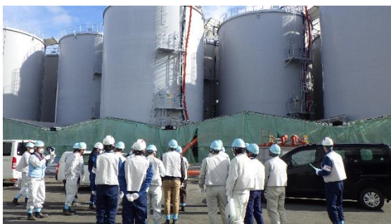
(写真2-2) 多核種除去設備処理水の分析・測定用タンク群 (K4タンクエリア) の状況確認の様子