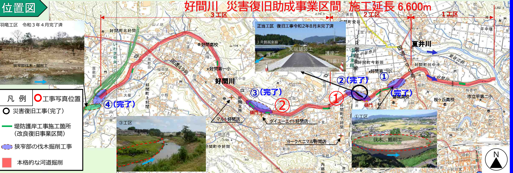
写真 好間川の改良復旧工事2, 3工区の本格的な河道掘削を実施している箇所を掲載しています。

令和元年東日本台風の甚大な被害に対応するため、好間川では令和2年8月末に破堤箇所への復旧工事が完了し、続いて令和3年9月末までに「狭窄部の伐木掘削工事」の全4箇所が完了しています。また、現在は「本格的な掘削工事」については、事業区間を全3工区に分割して施工しております。