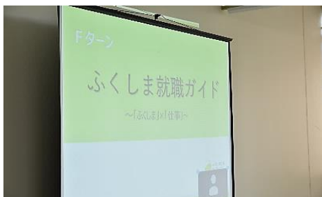
<福島県内の企業紹介>