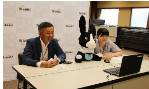
<各者の業務概要説明>