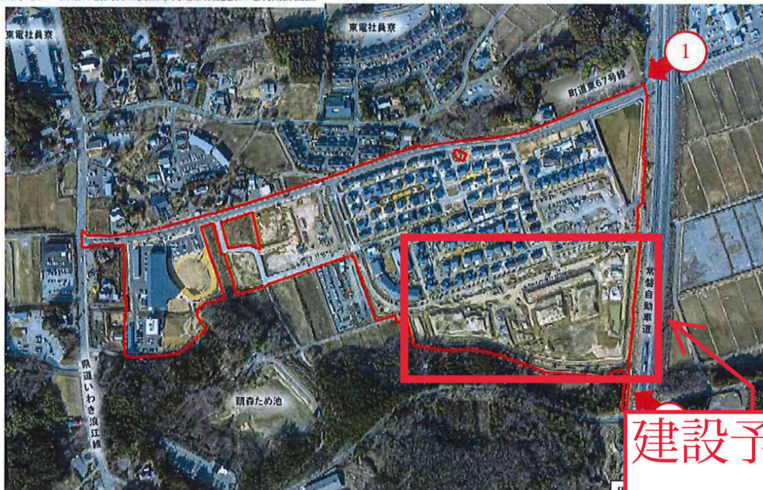
大川原地区一団地の復興再生拠点市街地形成施設土地利用計画図 (令和2年2月3日撮影)