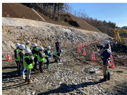
ドローン操作体験