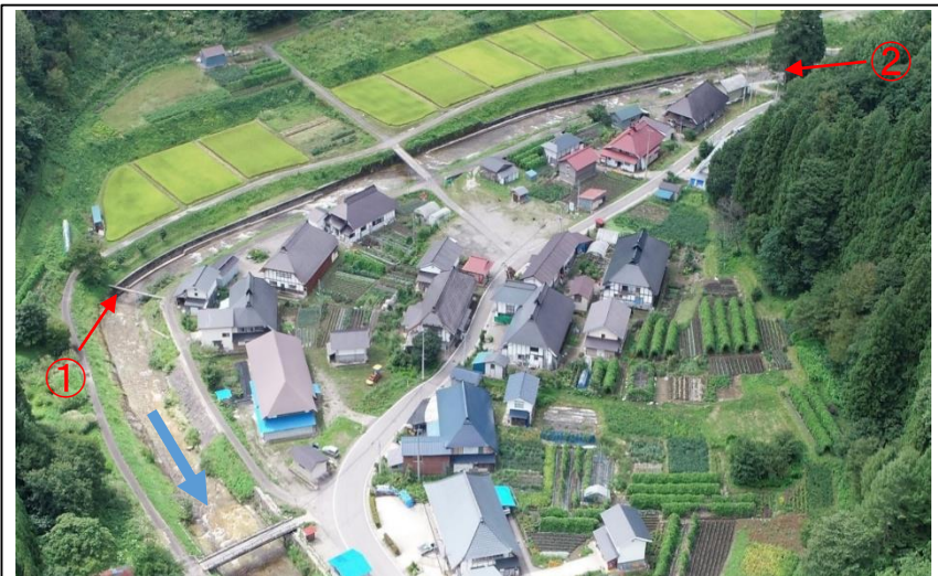
事業着手前(平成30年)