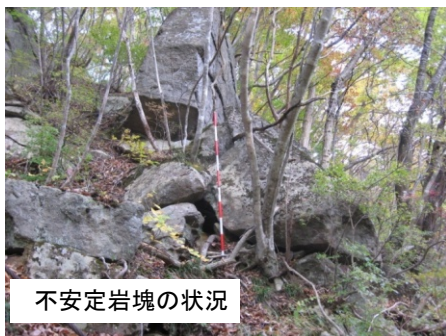
不安定岩塊の状況