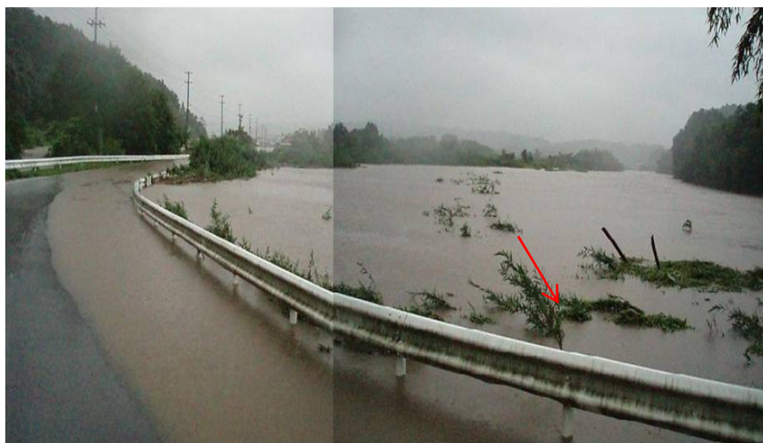
浸水状況 なつい 夏井川（いわき市）