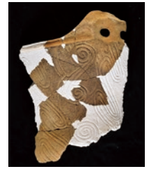
古殿町三株山麓遺跡 出土縄文土器

福島県の埋蔵文化財保護の草分けの時代である昭和20年代半ばから昭和40年代の取り組みを、史料や出土品から振り返ります。