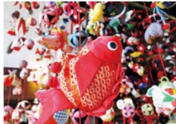
つるし飾り (過去の開催の様子)

3月3日のひな祭りに合わせ、いわき市中之作ちりめん細工教室「ままや」が子どもたちの健やかな成長を願って丹精込めて作成したつるし飾りを展示します。金魚や亀、エビなど当館で展示している生き物もふんだんに盛り込まれています。