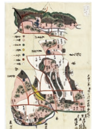
陸奥国伊達郡 西大枝村絵図

《休館のお知らせ》 2月19日(土)まで工事休館となります。 ※印は前売り券などが必要な有料のイベントです(他は入場無料)。予定につき内容が変更される場合があります。