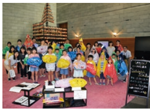
ワークショップ「楽しいそなえ」

いつ起こるか分からない災害に対して、自分が住む地域をよく知り、もしものときを想像しておくことは大切です。ぜひ展示を通して、意識の備え「そなえの芽」を持ち帰ってください。