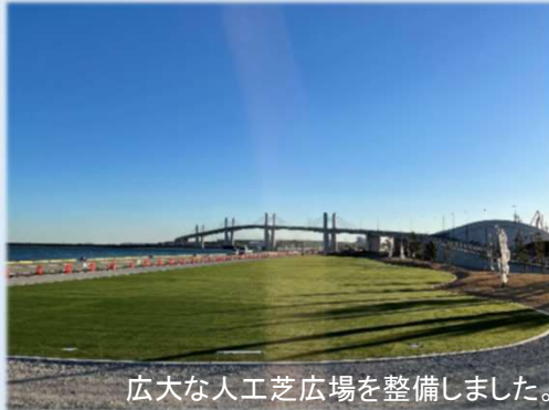
広大な人工芝広場を整備しました。

ワシントンヤシをはじめとし植栽された、様々な樹木や人工芝の緑豊かな空間と小名浜の海を同時に楽しむことができます。