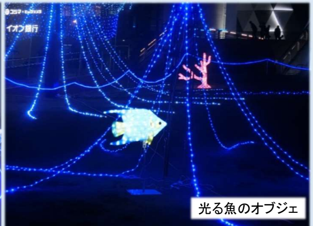
光る魚のオブジェ

11月20日(土)、小名浜港アクアマリンパークにイルミネーションが設置されました。イルミネーションは青色を基調とし、海をイメージした飾りつけされ、幻想的な空間を演出しています。他にも波をイメージした装飾や光る魚のオブジェ等が設置され、一層海を感じることができます。