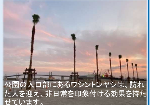
公園の入口部にあるワシントンヤシは、訪れた人を迎え、非日常を印象付ける効果を持っています。