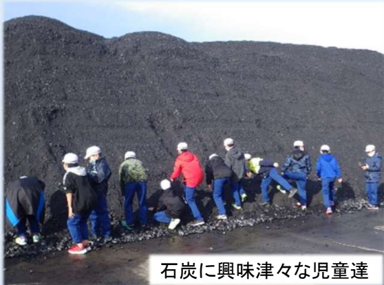
石炭に興味津々な児童達

※県の事務所で実施した見学のみを計上しており、国の事務所で実施した見学は含みません。