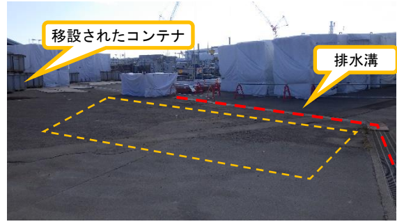
(写真 2 - 2)

当該仮設集積場所におけるコンテナの保管状況（令和 3 年 11 月 1 日撮影）