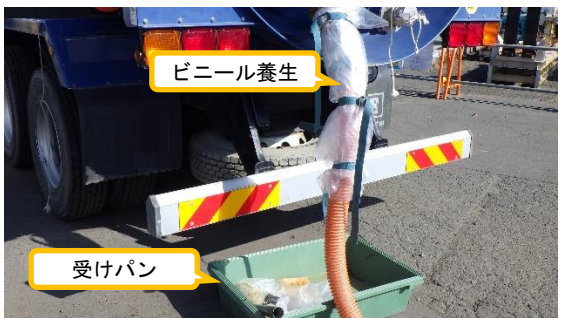
(写真 3 - 3)