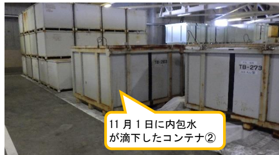
(写真1-2) 内包水が滴下したコンテナの 保管状況②