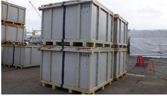
(写真 2 - 1)

当該仮設集積場所におけるコンテナの保管状況（令和 3 年 11 月 1 日撮影）