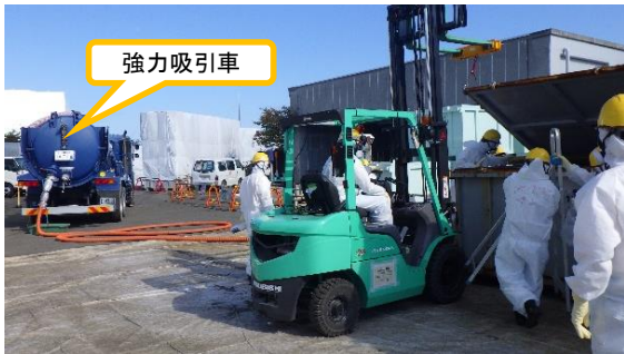
(写真 3 - 2)