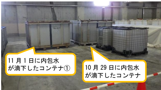
(写真1-1) 内包水が滴下したコンテナの 保管状況①