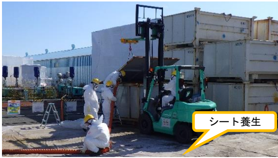
(写真 3 - 1)

コンテナの移設後の状況（黄枠部分にコンテナが保管されていた。） （令和 3 年 11 月 4 日撮影）