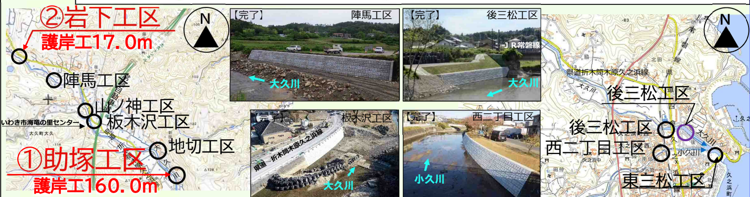
写真 現在、災害復旧工事等を実施している代表的な箇所を掲載しています。

位置図 凡例 ○ 災害復旧工事(施工中) ○ 災害復旧工事(完了) ○ 交付金工事(完了)