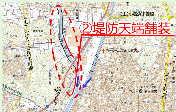
写真 現在、災害復旧工事等を実施している代表的な箇所を掲載しています。