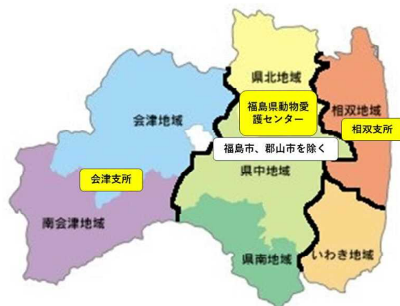
図1 動物愛護管理業務の管轄

管轄地域 相馬市、南相馬市、広野町、檜葉町、富岡町、川内村、大熊町、双葉町、浪江町、葛尾村、新地町、飯舘村