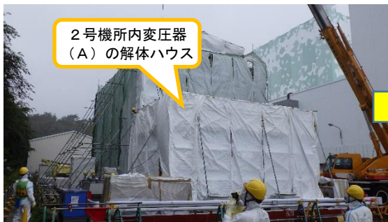
(写真2-1) 2号機所内変圧器 (A) の解体ハウスの状況 (令和3年10月6日撮影)