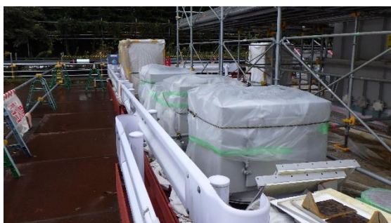
(写真2-4) 外装品のビニール養生の状況