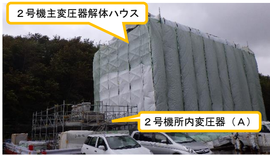
(写真1) 2号機主変圧器及び2号機所内変圧器 (A) の状況