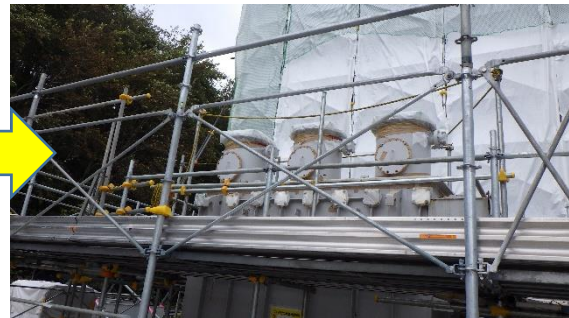
(写真2-2) シートが取り外された解体ハウスの状況 (令和3年10月26日撮影)