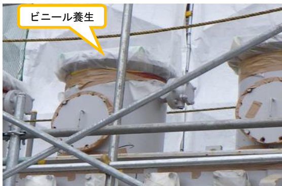
(写真2-3) 2号機所内変圧器 (A) の開口部のビニール養生の状況