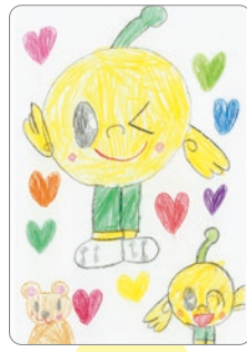
ウインクがとっても キュートだね☆