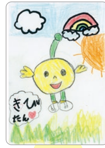
てんき よ 天気も良くて、 キビタンもうれしそう♪