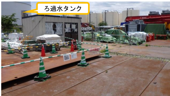
(写真2-1) エリア整備作業開始前の状況 (北西側から撮影) (令和3年5月25日撮影)