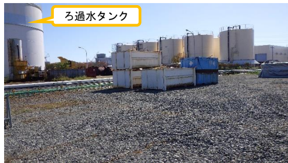
(写真2-2) エリア整備作業開始後の状況 (北西側から撮影) (令和3年10月14日撮影)