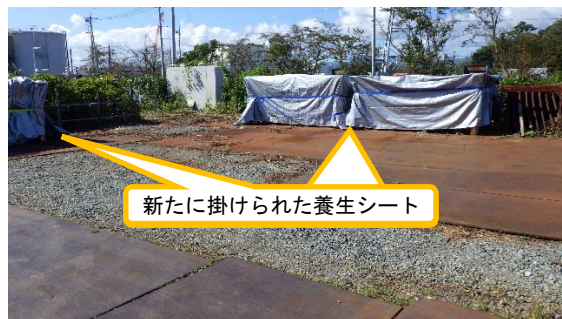
(写真3-2) エリア整備作業開始後の管理者不明 コンテナの保管状況 (令和3年10月14日撮影)