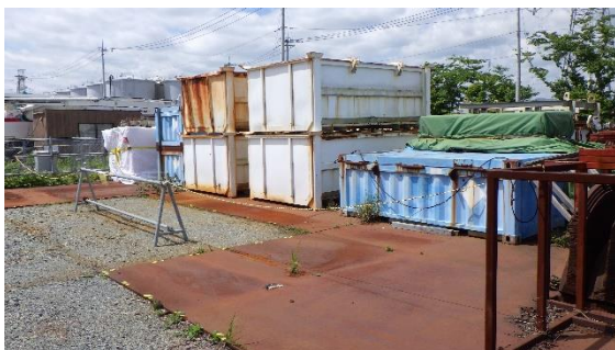
(写真3-1) エリア整備作業開始前の管理者不明 コンテナの保管状況 (令和3年5月25日撮影)