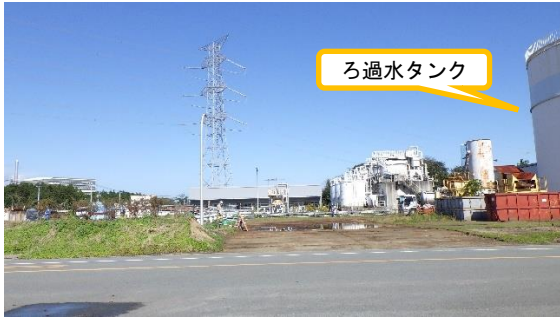
(写真1) 1-4号サブドレン他集水設備移設 予定箇所の外観 (南側から撮影)