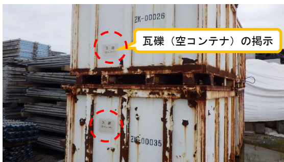
(写真3) 旧コンテナの保管状況