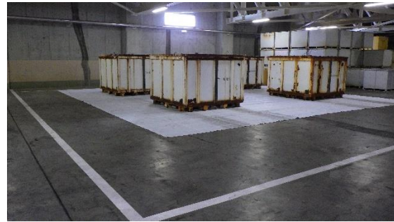
(写真1-2) 固体廃棄物貯蔵庫第2棟に運搬 されたコンテナ (令和3年5月19日撮影)