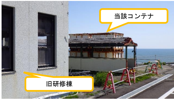
(写真1-1) 旧研修棟南東側に置かれていた コンテナ (令和3年4月27日撮影)