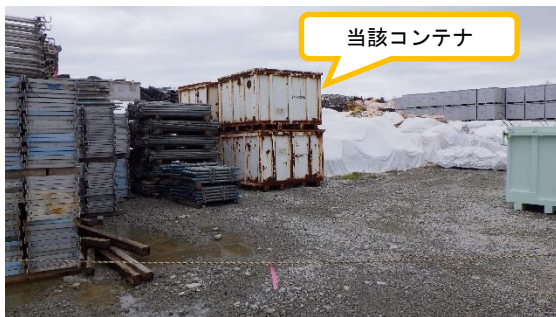
(写真2) 第二土捨て場に保管されている 旧コンテナ