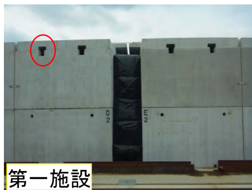
ボックスカルバートの換気口の例