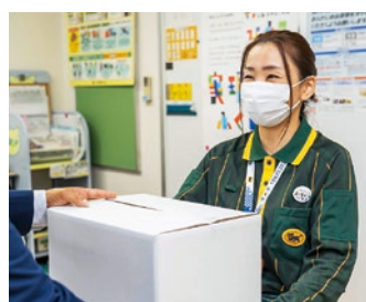
新スローガン缶バッジを着用したセールスドライバーが配達しています。

ヤマト運輸株式会社福島エリアは、県の新スローガンに共感し、『広報隊』に参加しました。缶バッジを着用したセールスドライバーが皆さんに宅急便をお届けしたり、荷物の配送受付などを担当する宅急便センターでポスターやのぼり旗を掲示したりするなど、「福島県の皆さんの想い」を発信しています。