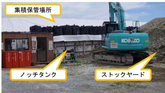
(写真2-2) ノッチタンクの活用状況① (ストックヤードと集積保管場所の仕切りに活用)