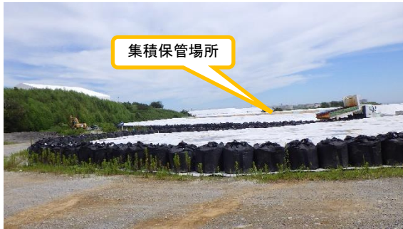
(写真1) 瓦礫類の保管状況 (瓦礫類を集積し、シート養生して保管)