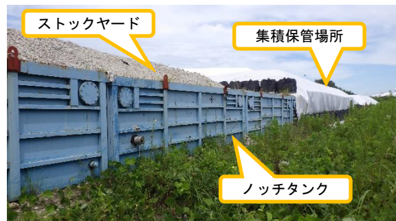
(写真2-3) ノッチタンクの活用状況② (ストックヤード等の擁壁に活用)