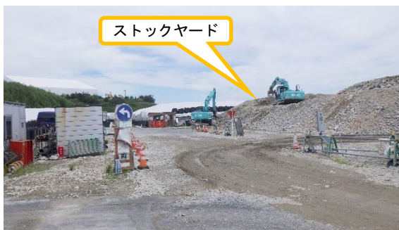
(写真2-1) ストックヤードの状況 (エリア入口から撮影)