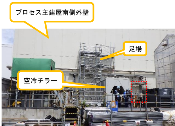
(写真1-1) プロセス主建屋南側の状況 (南側から撮影) ※赤破線が干渉物撤去跡