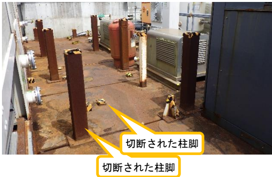
(写真 2 - 2) 柱脚切断跡の例 (南側から撮影)