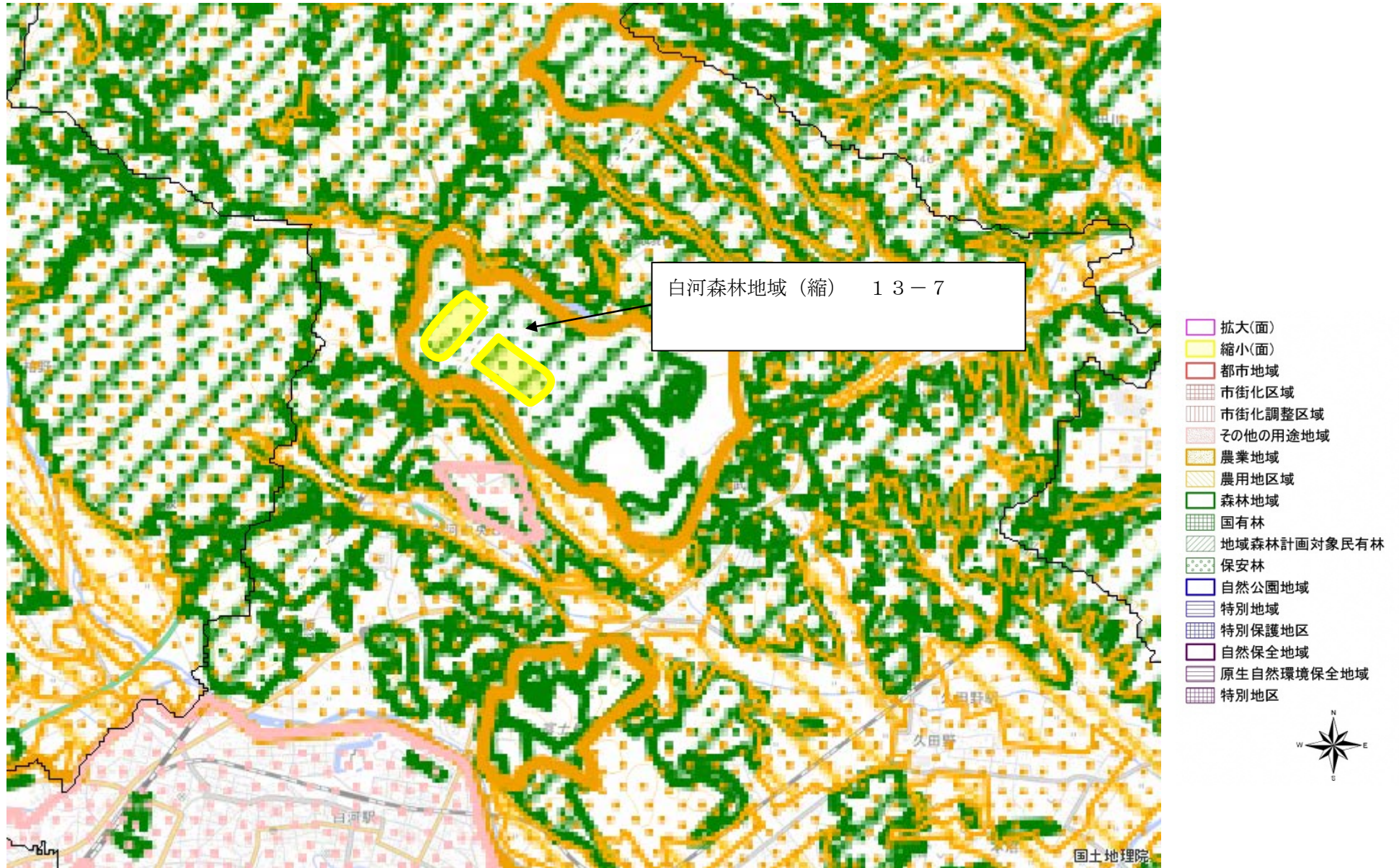
図の中心位置： 37.150, 140.230（北緯,東経） 縮尺 1:50000