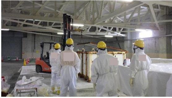
(写真1) コンテナの内容物確認作業の状況