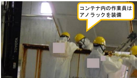
(写真2) コンテナ内の土壌採取の状況