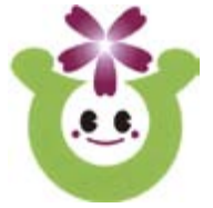
道の駅ひらた キャラクター ジュッピーちゃん

平成21年5月にオープンした「道の駅ひらた」。村内産の野菜などを販売する直売コーナーや、手打ちそばと旬の野菜を使ったてんぷらが人気の食堂などがあり、村の特産品を