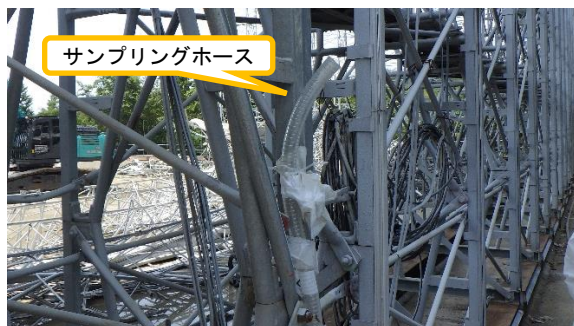
(写真 2 - 3) 連続ダストモニタのサンプリング 箇所の一例 (エリア北東側)