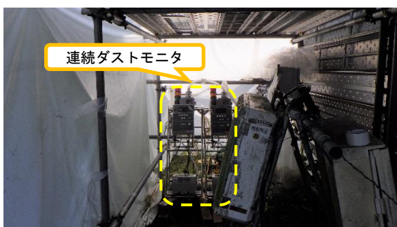
(写真2-2) エリア北側に設置されていた 連続ダストモニタ