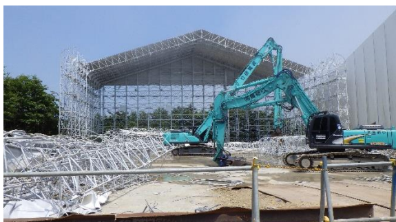
(写真1-3) 一時保管エリアA1の状況