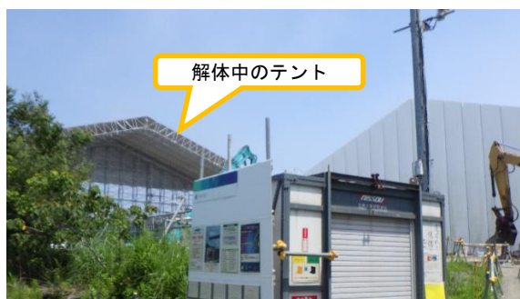
(写真1-2) 一時保管エリアA1の外観 (今回撮影：令和3年7月20日)