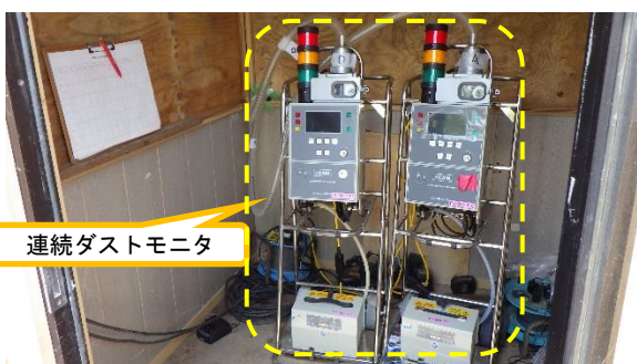
(写真2-1) エリア南側に設置されていた 連続ダストモニタ