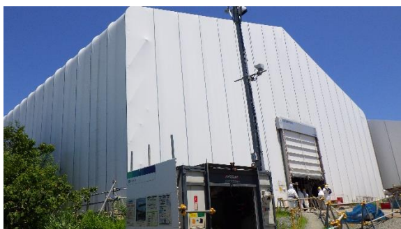
(写真1-1) 一時保管エリアA1の外観 (前回撮影：令和3年6月28日)