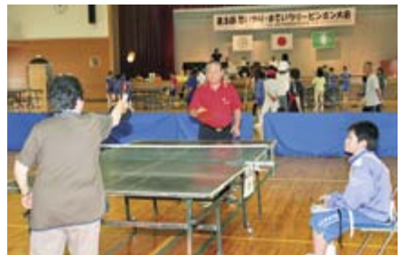
前回のまでいラリーピンポン大会の様子

12月9日(日)、県青少年会館体育館で、震災前から行っていた卓球のラリーがどれだけ続くかを競う「思いやりまでいラリー」ピンポン交流会を開催します。子どもから大人まで誰もが楽しめるゲームで、相手への「思いやり」がポイントです。参加は無料で、参加希望の方は、二人一組または個人でお申し込みください。(11月30日まで)。