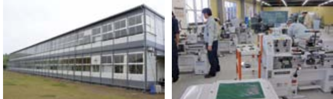
サテライト校の整備状況