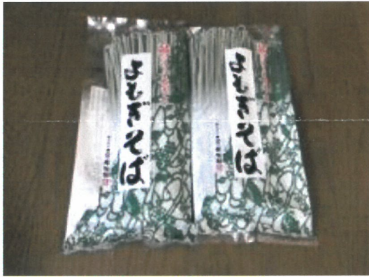
五十嵐製麺(喜多方産)