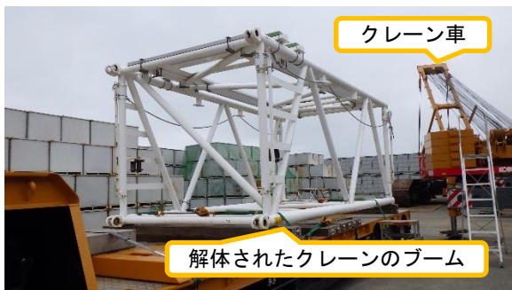
(写真3) クレーン車と解体されたブームの 状況