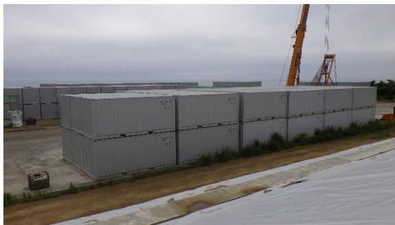
(写真1-2) エリア南側のコンテナ保管状況 (西側から撮影)