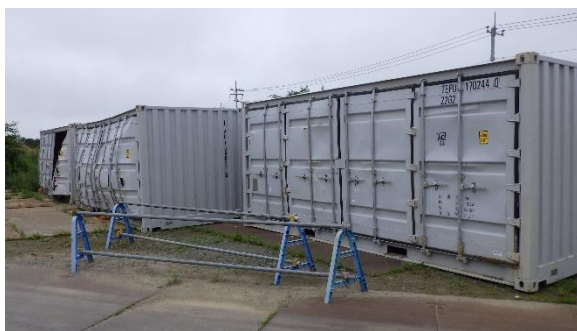
(写真2) エリア入口に保管されていた一部が 破損したコンテナ