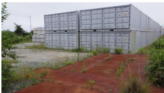
(写真1-3) 隣接する使用済保護衣等一時保管 エリア (北側から撮影)