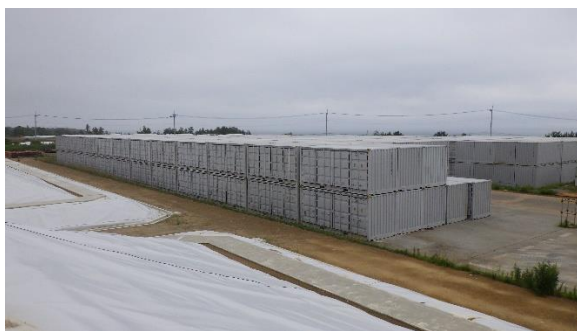
(写真1-1) エリア北側のコンテナ保管状況 (西側から撮影)