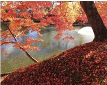
4. 棚倉城跡（棚倉町） 問棚倉町観光協会 ☎ 0247-33-7886