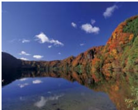
5. 沼沢湖（金山町） ぬまざわこ 問金山町産業課 ☎ 0241-54-5327