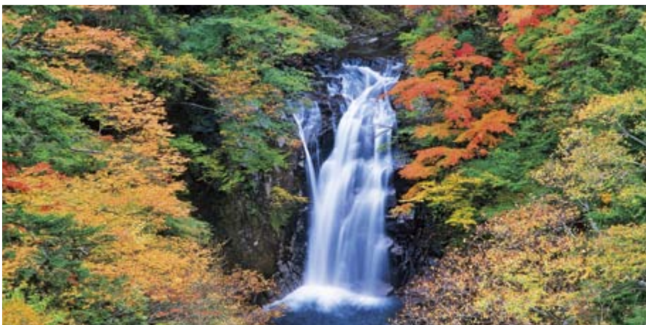
7. 浅見川大滝（広野町） あさみがわ 問広野町建設課産業グループ ☎ 0240-27-4163