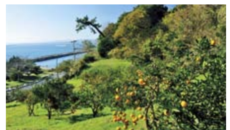
8. 三崎公園（いわき市） みさき 問いわき市観光交流課 ☎ 0246-22-7477