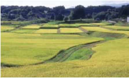
2. 白沢地区の田んぼ（本宮市） 問本宮市白沢総合支所産業建設課 ☎ 0243-44-2111