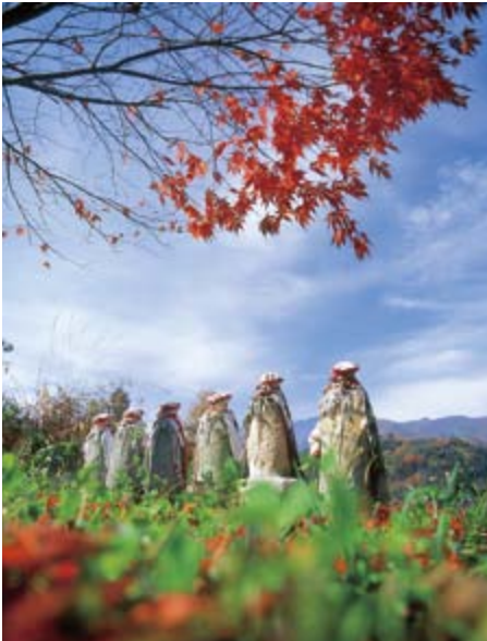
3. 秋空と紅葉とお地蔵様（南会津町） 問南会津町商工観光課 ☎ 0241-62-6200