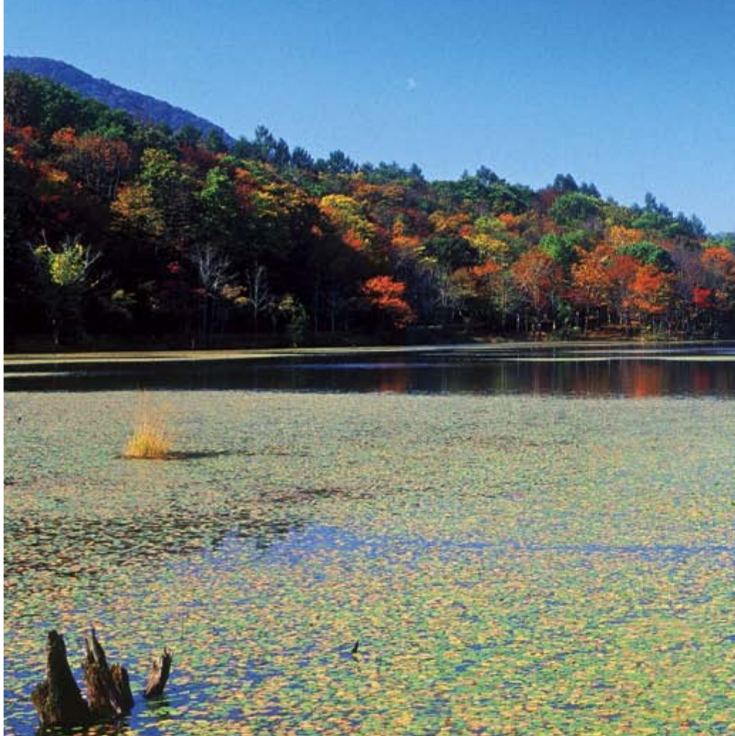
1. 観音沼（下郷町） かんのんぬま 問下郷町商工観光係 ☎ 0241-69-1144