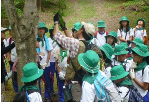
■ 森林環境学習を支援（森林環境基本枠）

【実績】県内の666校（全体の72パーセント）の小中学校で森林環境学習を実施。集落周辺や街道沿線の森林の整備など、地域の課題に対応した森林整備の実施のほか、図書館や公民館等の市町村有施設や、小中学校や幼稚園等の保育施設において、県産材