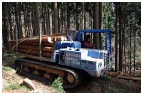
■ 間伐材搬出の支援