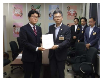
■ 森林づくりの提言

さらに、令和2年3月27日には、森林環境税について、現在の7つの施策展開の継続、拡充により制度を継続すべきとする「森林環境税を活用した取組に対する意見」を取りまとめた。