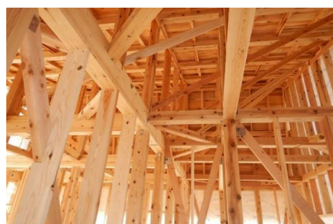
■ ポイント交付住宅

イ 県産材を活用した住宅の新築・増改築及び購入に対しポイント交付や地域住宅生産者の活動への支援