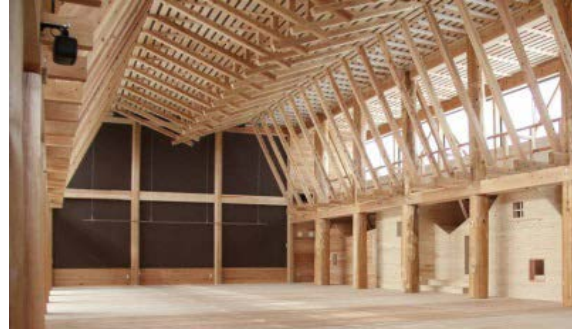
■ 県産材の利活用推進（地域提案重点枠）