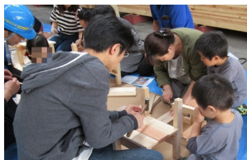
■ 木とのふれあい創出

2020 大会選手村ビレッジプラザの建築部材 113 立方メートル使用。大会関連施設に県内小中学校児童生徒が関わり木製ベンチ 250 脚を製作。