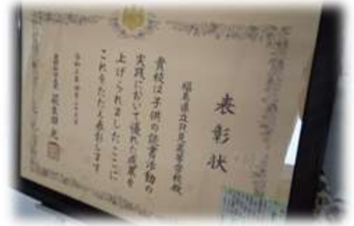
【図書室前に掲示された栄えある表彰状】

優秀実践校に選ばれた只見高校ですが、学校司書は配属されておらず、司書教諭資格を持つ先生方、そして“生徒たち”によって読書活動が推進されています。工夫された数々の取組を紹介します。