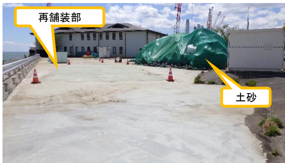
(写真1-1) 前回の状況 (4月26日撮影)