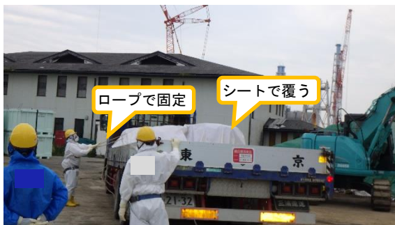
(写真1-3) 積み荷の固定の状況