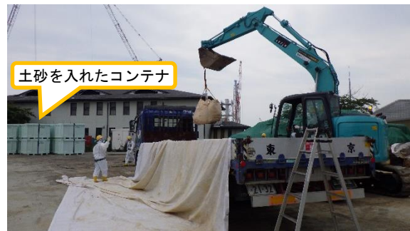
(写真1-2) 今回の状況 (6月8日撮影)