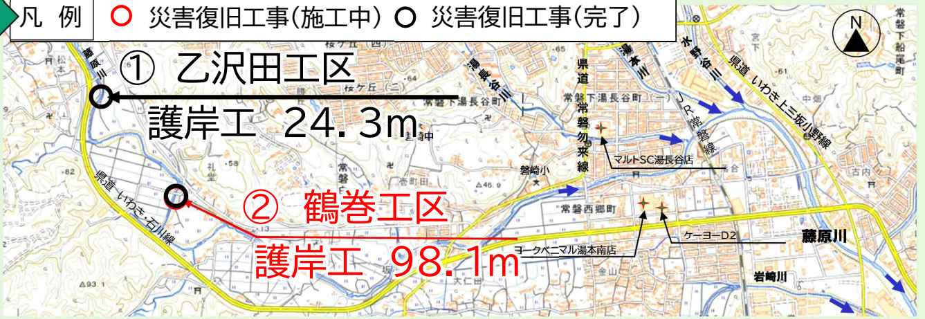
写真 現在、災害復旧工事を実施している代表的な箇所を掲載しています。