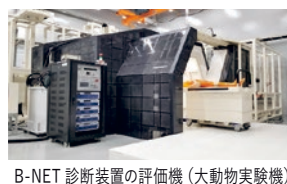
B-NET 診断装置の評価機 (大動物実験機)

当社が開発した「SiC 超小型加速器中性子源」を使用する事で、従来の原子炉や大型の加速器 (サイクロロン) を使った大規模な中性子照射設備ではなく、患者の周囲に複数の超小型加速器中性子源を配置する事が可能となり、多門照射 (複数方向から同時に中性子を照射) を非常にコンパクトに、かつ低コストで実現できます。多門照射を行う事で、体の奥深くにある患部まで中性子が届けられるようになり、体深部の病巣まで診断可能な B-NET 診断装置を提供できるようになります。