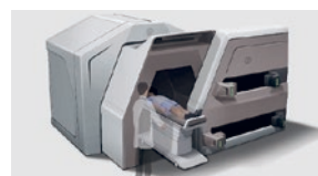
B-NET 診断装置イメージ図