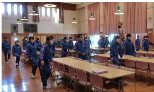
【片足立ちをして運動前の感覚を確認】

続いて、短期大学部の学生が、柔軟性や体幹を整えるための「くの字運動」や「ラディアン」など、限られたスペースでも気軽にできる運動の実技指導を行いました。実技指導が終わると、再度、前屈と目を閉じたままの片足立ちを行いました。運動前と運動後を比較し、身体感覚の違いを体感しました。