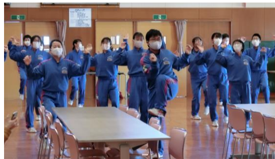
【体幹を整える効果がある「ラディアン」を体験】

子どもたちは、部屋の中などのちょっとしたスペースで取り組める運動を行うことにより、柔軟性を高めたり、体幹を整えたりすることを学びました。