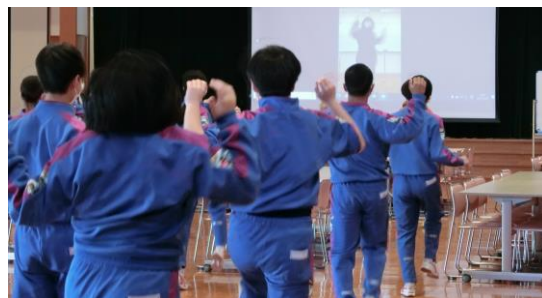
【大学生によるオンラインの運動指導】

子どもたちは、部屋の中などのちょっとしたスペースで取り組める運動を行うことにより、柔軟性を高めたり、体幹を整えたりすることを学びました。