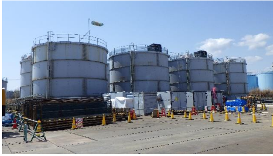
(写真1-1) 解体予定のタンクの状況