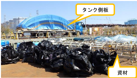
(写真1-2) タンク側板の積載等の状況