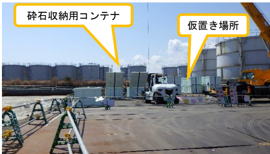
(写真2) 砕石除去の状況