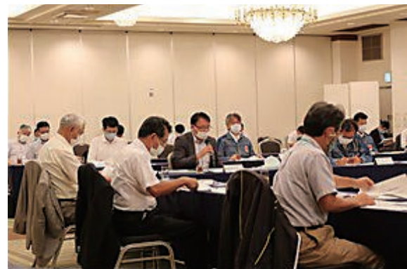
第1回廃炉安全確保県民会議