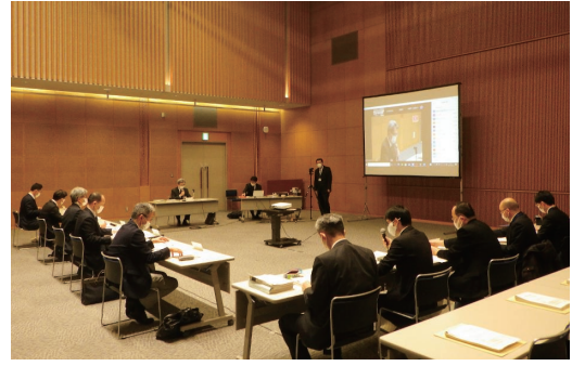
第4回環境モニタリング評価部会