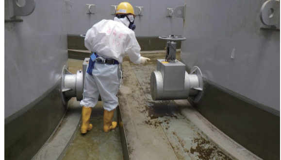
原子力安全対策課榎葉町駐在による現場確認

職員2名体制でローテーションを組み、平日は毎日、福島第一原発の立ち入りを行い、トラブル発生時等は休日夜間を問わず速やかに現場確認を行っている。