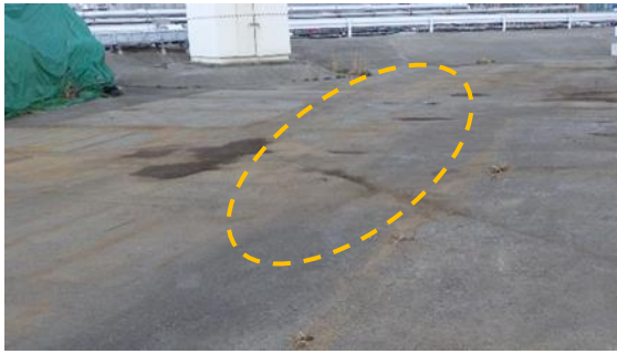
(写真1-1) 瓦礫一時保管エリアW2 (黄枠部分がβ線の線量率が高い箇所) (北西側から撮影) (令和3年3月23日撮影)