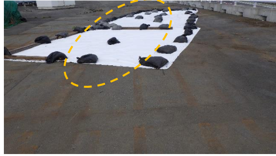
(写真1-2) シート養生がされている (令和3年3月26日撮影)