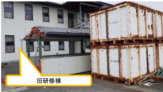
(写真3) 旧研修棟付近のコンテナ