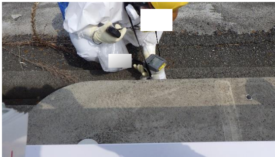
(写真2) 枝排水路の線量率を測定する様子