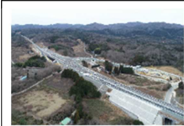
常磐双葉IC 令和2年3月7日開通