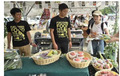
地域づくり活動支援