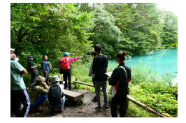
磐梯山ジオパーク モニターツアー