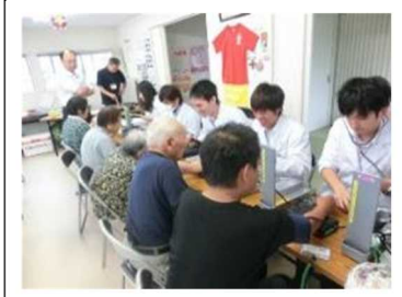
地域医療体験研修事業