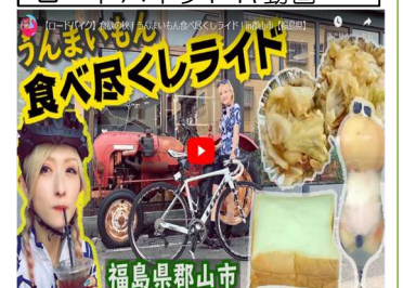
ロードバイクPR動画