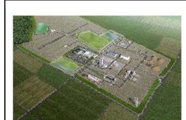
ロボットテストフィールド (南相馬市・浪江町)