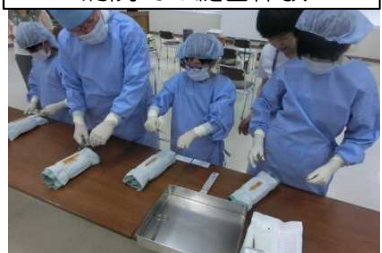
病院での縫合体験