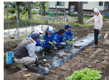
教育旅行（農業体験）の様子