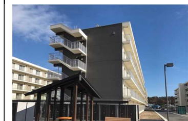
復興公営住宅（南相馬市）