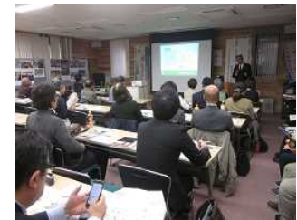
農家民宿モニターツアー