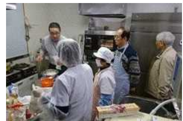
たのせ地区特産品開発講習会の様子

◆講習会の開催などにより、地域の農産物を生かした 6 次化の商品づくりを進めるとともに、首都圏等での物産展を開催するなど、商品開発や販路の拡大に取り組んでいます。