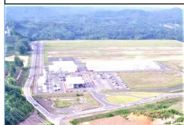
工業の森・新白河B工区