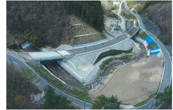
国道 114 号山木屋 1 工区の整備

◆令和元年 10 月の台風第 19 号について、管内 8 市町村に情報連絡員（県リエゾン）を派遣し、被害状況等の情報収集や県情報の提供に努めた。 ・派遣実績 延 215 名