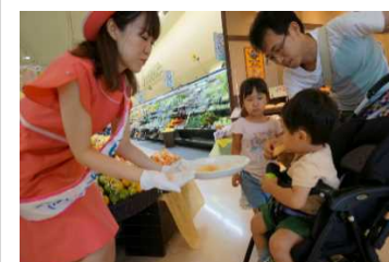
「おいしいふくしまいただきます！」 キャンペーン