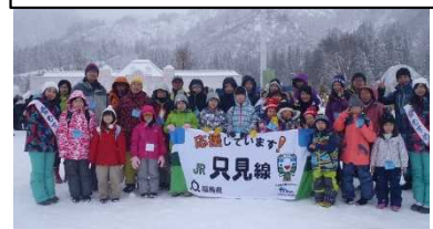
JR 只見線活用促進事業 「JR 只見線で行く!只見ふるさと の雪まつり満喫ツアー」

◆JR 只見線の早期全線復旧に向けて、只見線活用計画に基づき、只見線ツアーの実施や関係機関と連携して情報発信を行うなど、只見線活用促進の取組を支援しています。