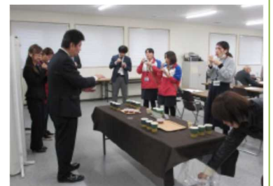
地域産業6次化の推進