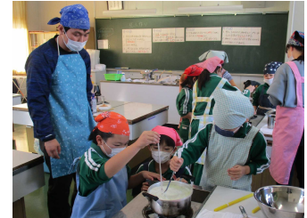
ふるさと教育 (田島第二小学校 豆腐作り)