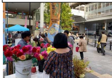
『秋のふくしま』うまいもの市